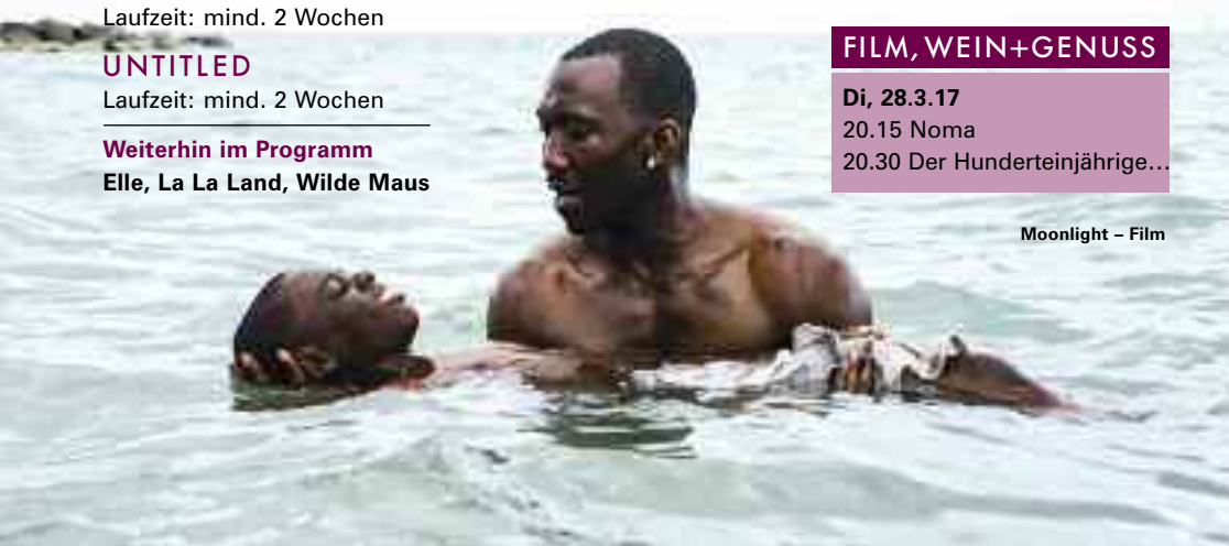
Moonlight – Film